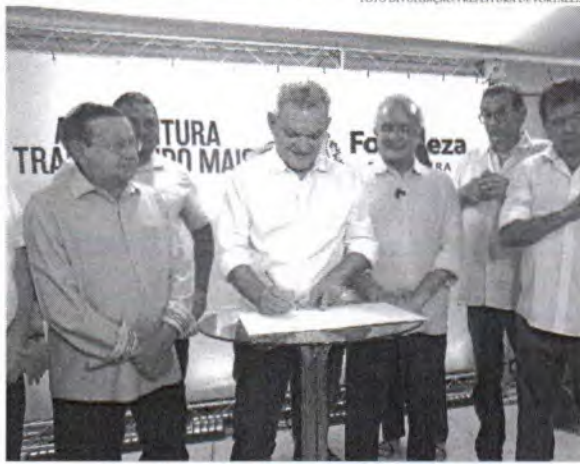
Com o novo contrato, o valor investido no Crio ultrapassa os R$ 33 milhões por ano

Entre os cuidados existentes, a demanda pela radioterapia se destaca na cidade. Antes do contrato, todos os anos já eram atendidos 2.532 pacientes nesse contexto. Agora, tal terapia será oferecida para 3.384 pessoas, o que representa um acréscimo de 852 usuários. "Os R$ 3,6 milhões representam 15% do aumento do repasse que o Governo Federal está fazendo para