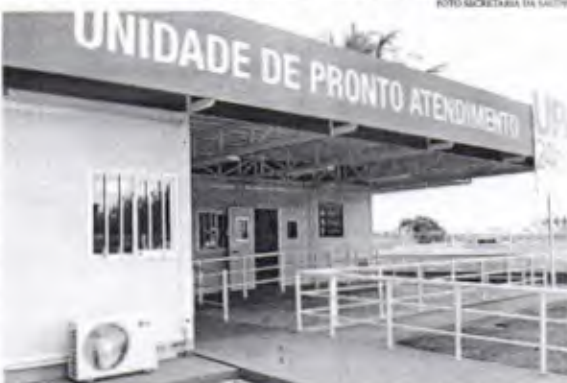
Os médicos afirmaram estar sofrendo com a sobrecarga de trabalho desde o mês de setembro